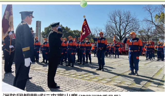
消防団観閲式に来賓出席(建設消防委員長)