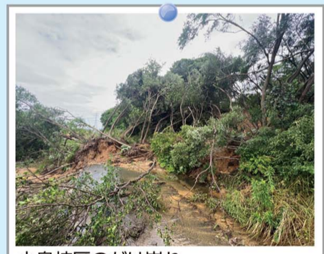
小島校区のかけ崩れ