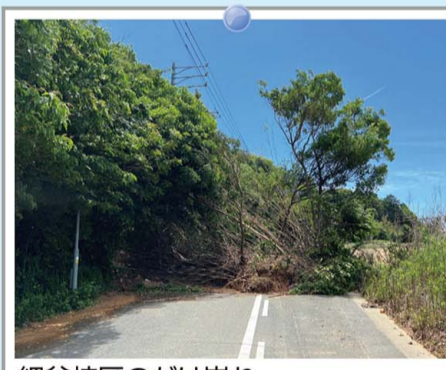
細谷校区のかけ崩れ