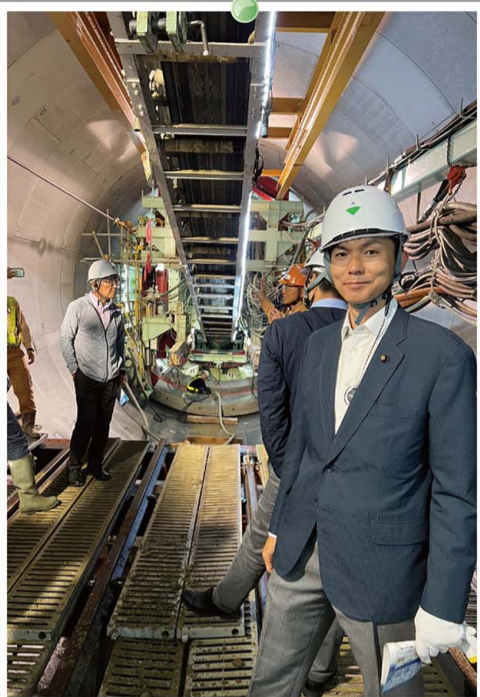
柳生川地下河川工事