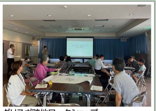
グリスボ跡地ワークショップ