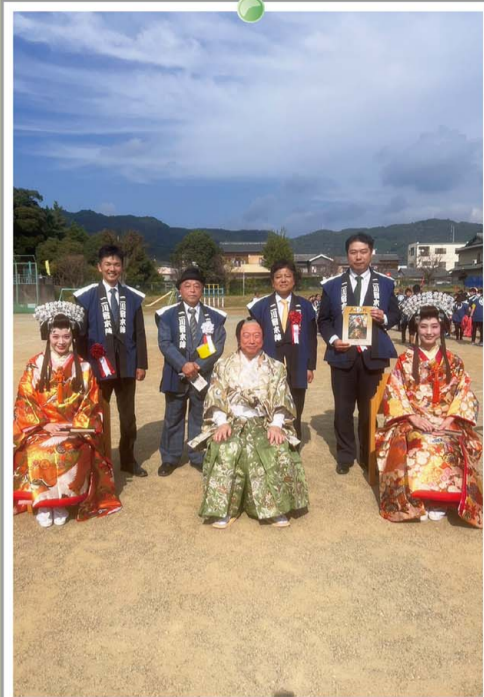
4年ぶりに二川宿本陣祭り(第30回)