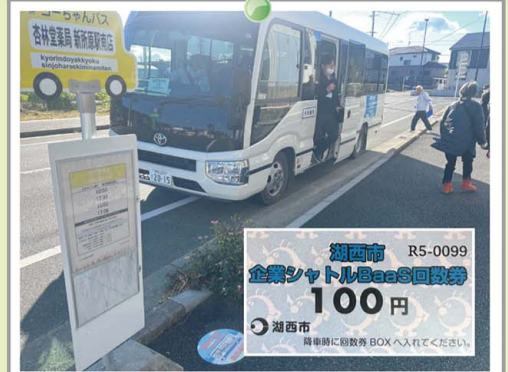
企業BaaSに乗車(社会実験、(株)デンソー)