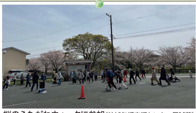
桜のふたがわウォークに参加(地域包括支援センター尽誠苑)