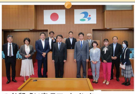
つくばみらい市 スマートインター