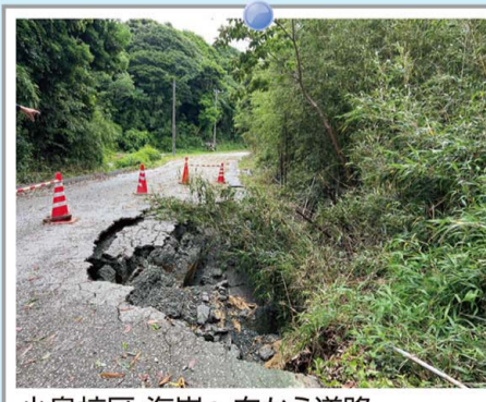
小島校区 海岸へ向かう道路