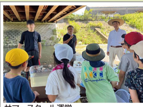
サマースクール運営