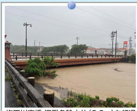
梅田川高橋 氾濫危険水位(3.9m)を超過