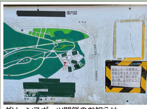
グリーンスポーツ閉鎖のお知らせ