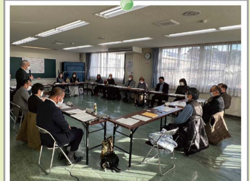
地域と市長のまちづくり懇談会