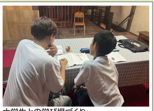
大学生との学び場づくり