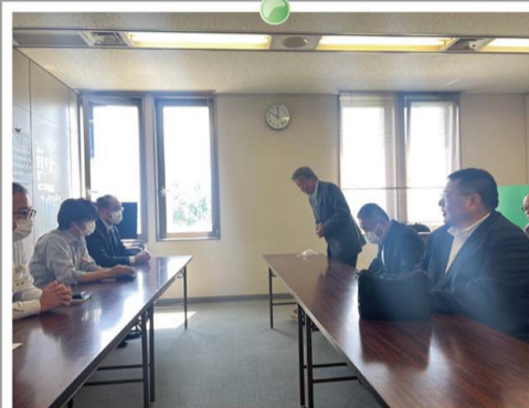
細谷校区自治会要望会