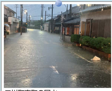
二川町東町の冠水